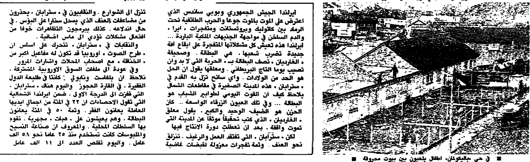
في حي جيليكولن، اطلال مليونين بين بيوت محروقة